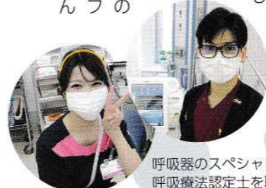
呼吸器のスペシャリスト 呼吸療法認定士を取得

が改善してくれば少しずつ人工呼吸器が肩代わりしていった部分を減らしていきます。そして、最終的には人工呼吸器を外すこととなります。これを「人工呼吸器から離脱する」と言います。人工呼吸器装着期間が長期化するとうつや様々な感染症を合併するため、呼吸器装着期間は可能な限り短時間であることが理想的です。具体的な呼吸器設定を指示するのは医師ですが、私たち看護師やリハビリスタッフなども協力して患者さんにとって最適な設定を考え、早期離脱を目指して積極的に介入していきます。 人工呼吸器からの早期離脱を示した手順を「人工呼吸器離脱プロトコル」と言い、当院の集中治療室でもこのプロトコルを8年前から活用しています。「プロトコル」とは「目的や根拠、方法などが詳細に記された実施計画書や手順書」という意味です。集中治療室でも呼吸器のスペシャリストを示す資格「呼吸療法認定士」を取得するスタッフが揃っています。患者さんの力になりたいと思うスタッフの気持ちの表れだと心強く感じます。 これからの重症患者の早期呼吸改善にスタッフ全員で積極的に取り組んでいきます。